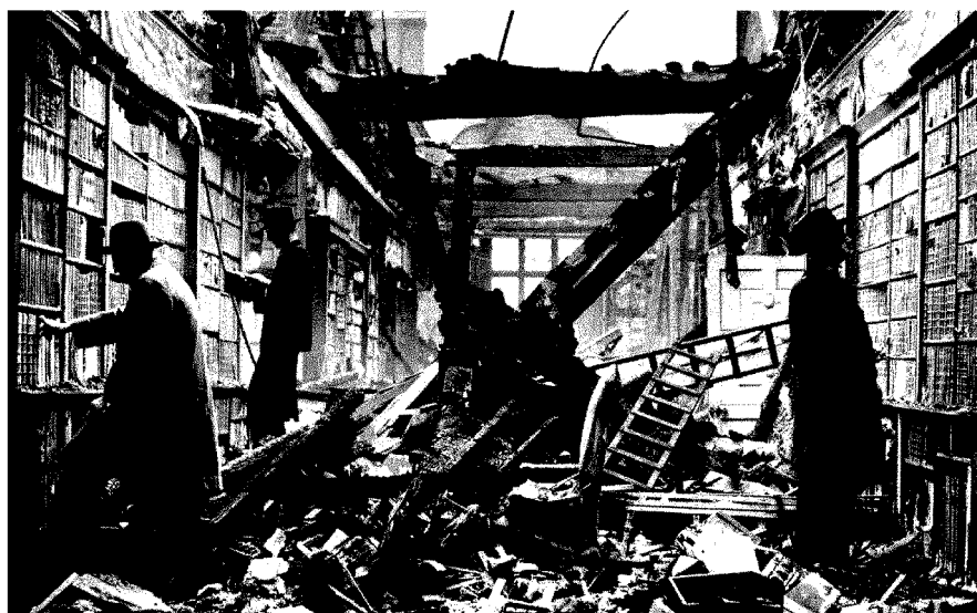
Nel 1940. Durante la seconda guerra mondiale, un bombardamento nazista su Londra distrusse la Biblioteca di Holland House

Non sempre questo capitale si trasferisce "per sempre" su tutte le strutture materiali che hanno contribuito ad accrescerlo: la vicenda del romano Teatro Valle, che più di 90 anni fa ospitò la prima del dramma emblematico della "rivoluzione", Sei personaggi in cer-